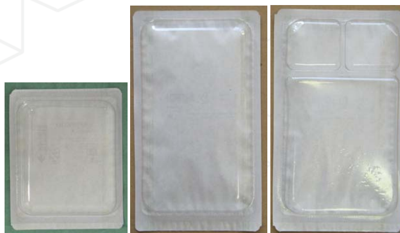
Code : 712057