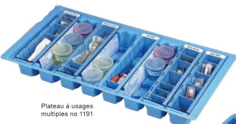
Plateau à usages multiples no 1191