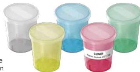
MediGobelet no 71.x