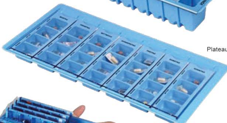
Plateau hebdomadaire no 291