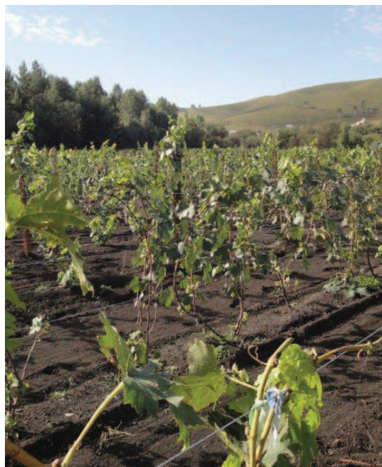
— La terre noire de l'Altaï, en Sibérie devrait être propice au développement des vignes d'origine franc-comtoise pour des vins de terroir. —