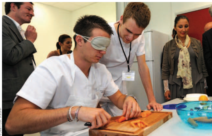
— Démonstration de travaux pratiques par les étudiants en ergothérapie et psychomotricité lors de l'inauguration le 24 septembre à Mulhouse. —

FORMATION Pour celles et ceux qui souhaitent devenir ergothérapeute ou psychomotricien, la rentrée 2012 s'est accompagnée de bonnes nouvelles. Les Régions du Grand Est (Alsace, Bourgogne, Champagne-Ardenne, Franche-Comté et Lorraine) se sont, en effet, unanimement engagées dans la voie de la coopération pour répondre aux besoins de ces métiers. Résultat : deux Instituts interrégionaux de formation financés par ces Conseils régionaux, l'un en ergothérapie (IIFE) et l'autre en psychomotricité (IIFP) ont ouvert leurs portes en septembre à Mulhouse. Le premier cursus, d'une capacité de 20 places, est ouvert aux Alsaciens, Bourguignons et Francs-Comtois. Quant au second, il accueille 25 étudiants des cinq régions concernées. Une première en France !