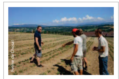
Ferme de Chosal