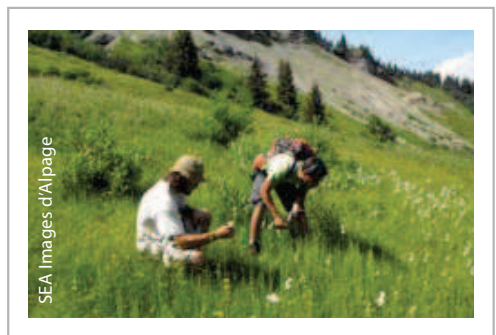
SEA Images d'Alpage

Le projet conjugue économie pastorale, insertion de personnels handicapés et biodiversité des prairies de montagne