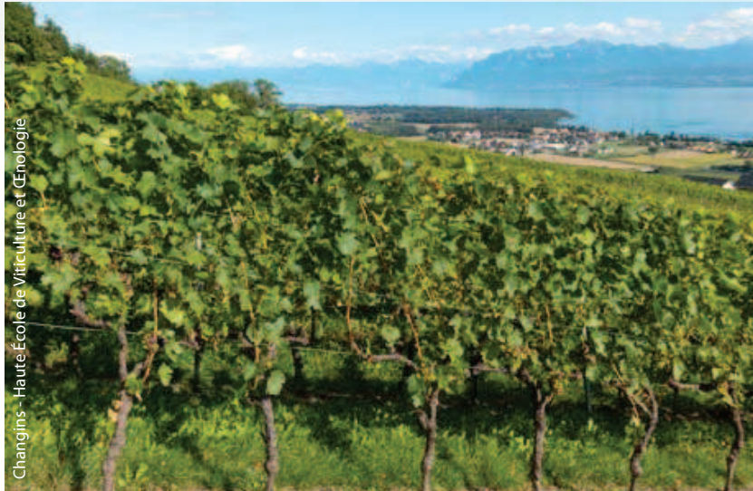
Changins - Haute École de Viticulture et Œnologie

Le projet vise une meilleure connaissance globale de la minéralité des vins blancs de la zone franco-suisse pour ensuite informer et accompagner producteurs et consommateurs.