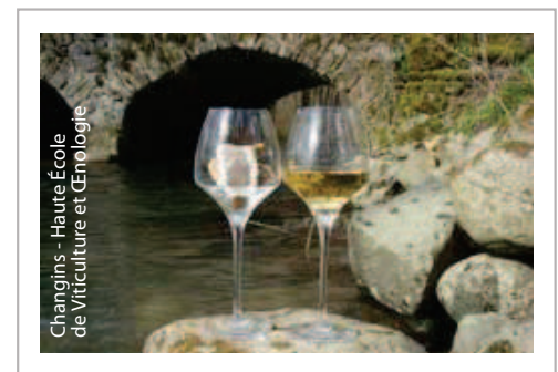
Changins - Haute École de Viticulture et Œnologie